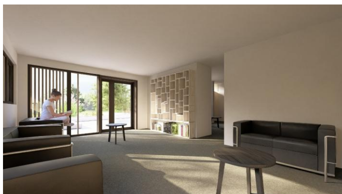
Vue d'une salle d'activité

Dans un espace totalement remodelé, il comprend au RDC