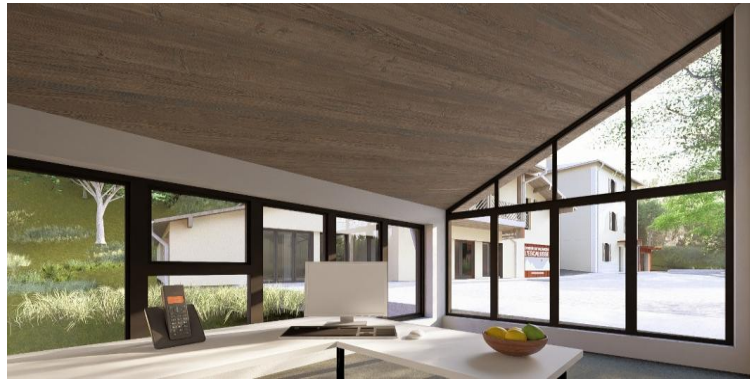
Vue du bureau du gestionnaire

Au RDC, outre la nouvelle cuisine et le local technique, 2 salles à manger Les bureaux Un vestiaire du personnel. A l'étage, un logement pour du personnel saisonnier.