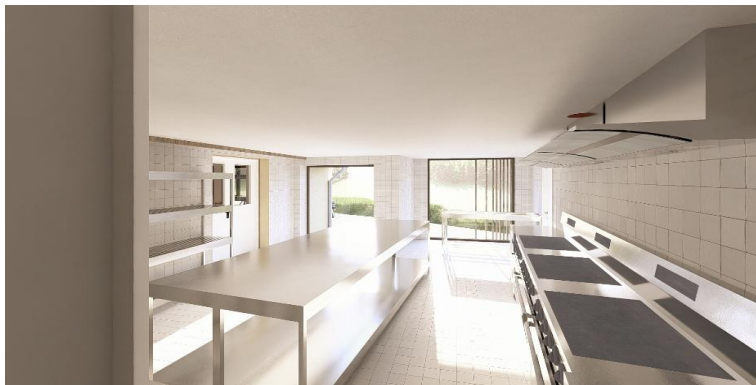
Vue de la nouvelle cuisine

La création d'une nouvelle cuisine fonctionnelle et répondant aux normes actuelles se fera par la création d'une extension du Bât C. Elle sera en ossature bois et des matériaux légers et modulables. Le recours à la préfabrication en usine permet de réduire les délais et les coûts. Un local technique sera aussi intégré à l'extension.